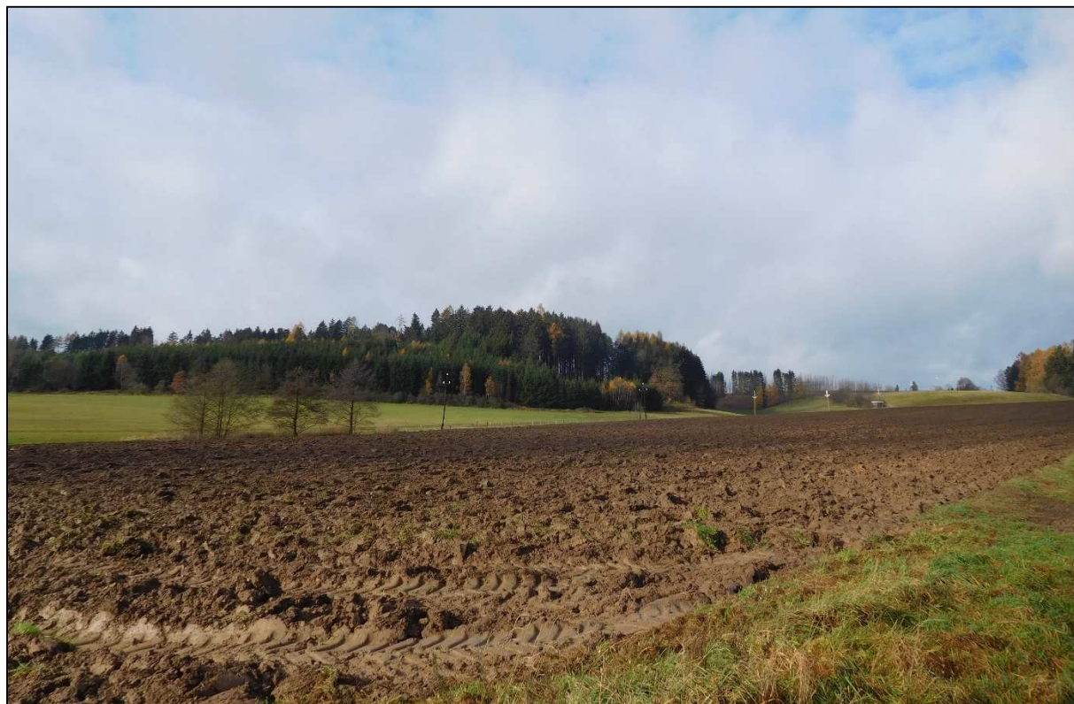
Panorama polní krajiny u Litoboře