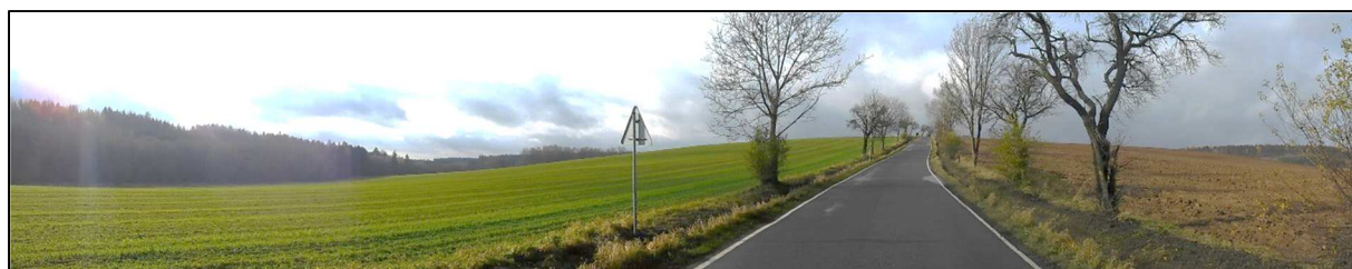
Panorama cesty Hoříčky - Brzice