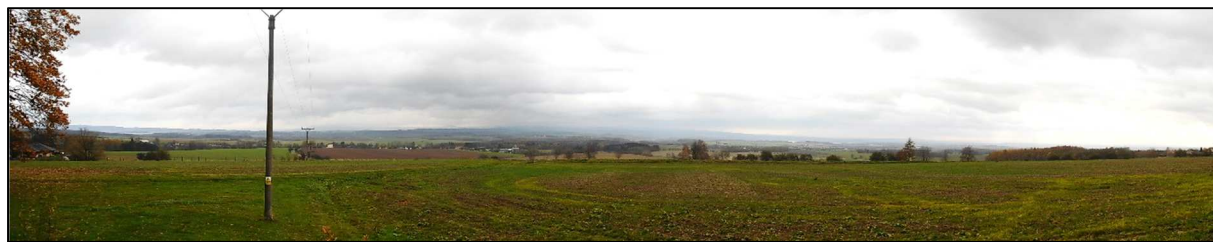
Lesozemědělská krajina u Mezilečí